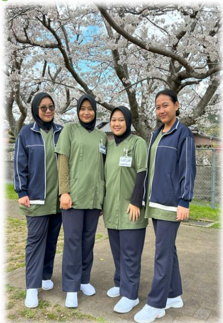
(アトリア・イイン・アイダ・ノヴィ)